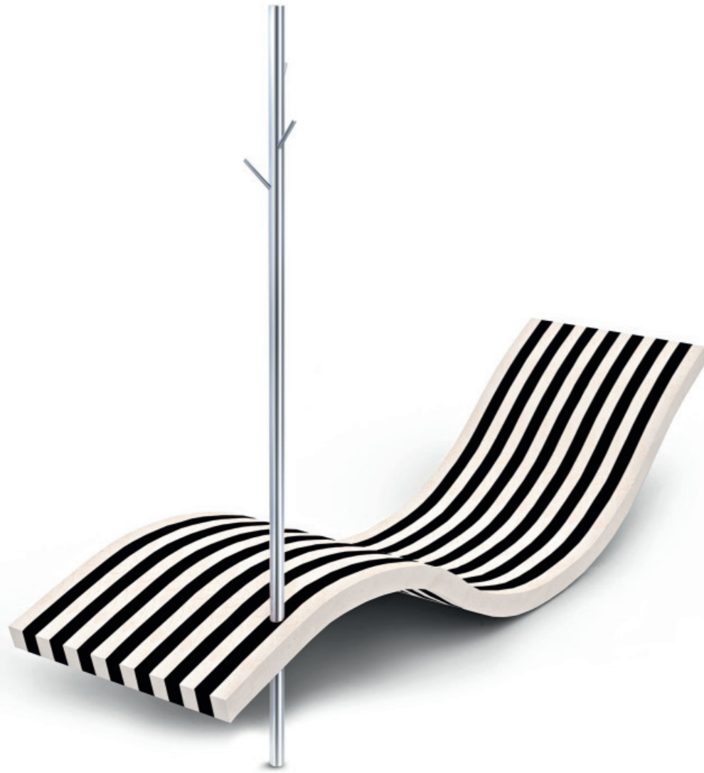
HANEL NATURSTEINMANUFAKTUR Wave