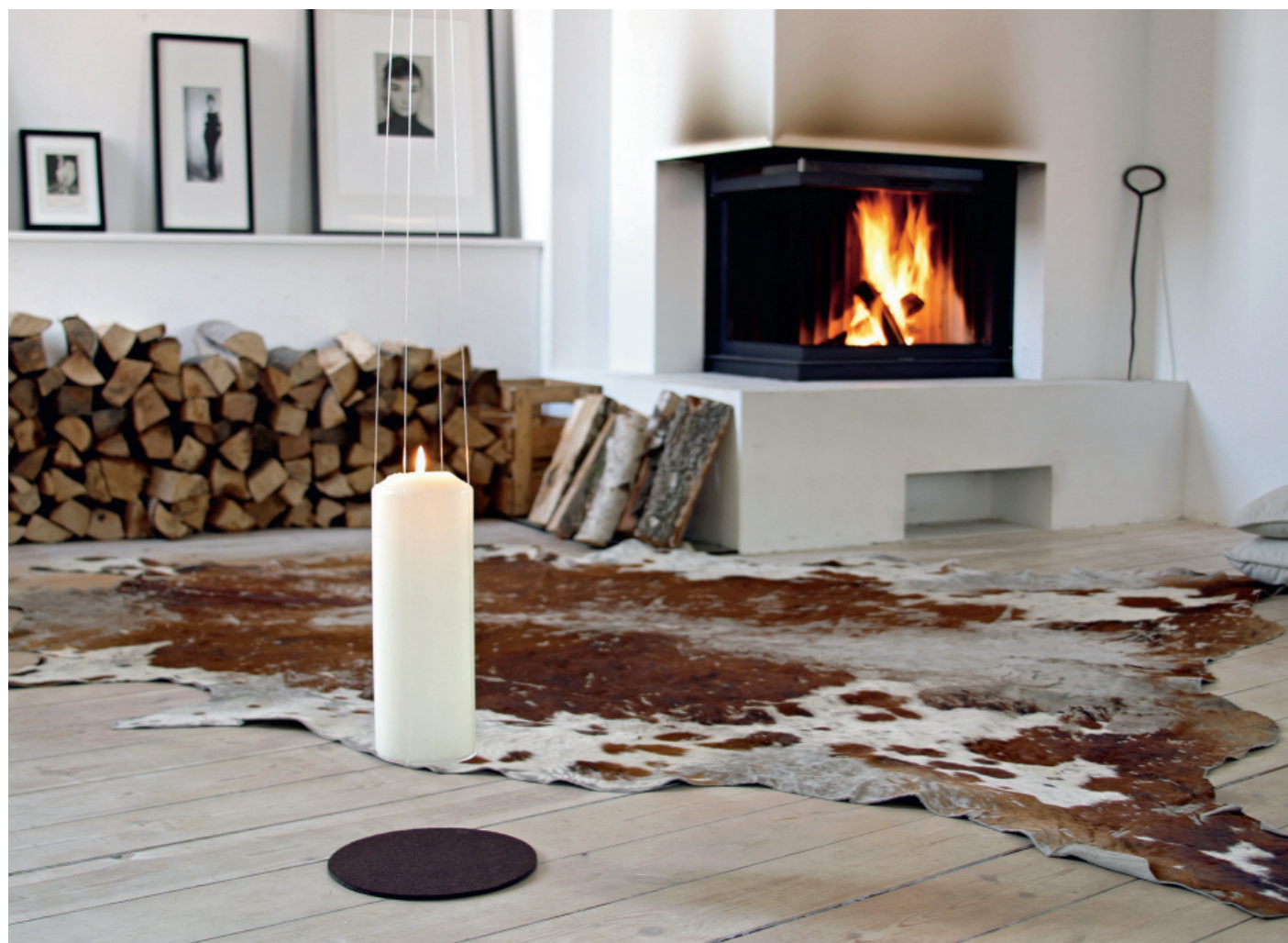
LOOM LIVING Feen