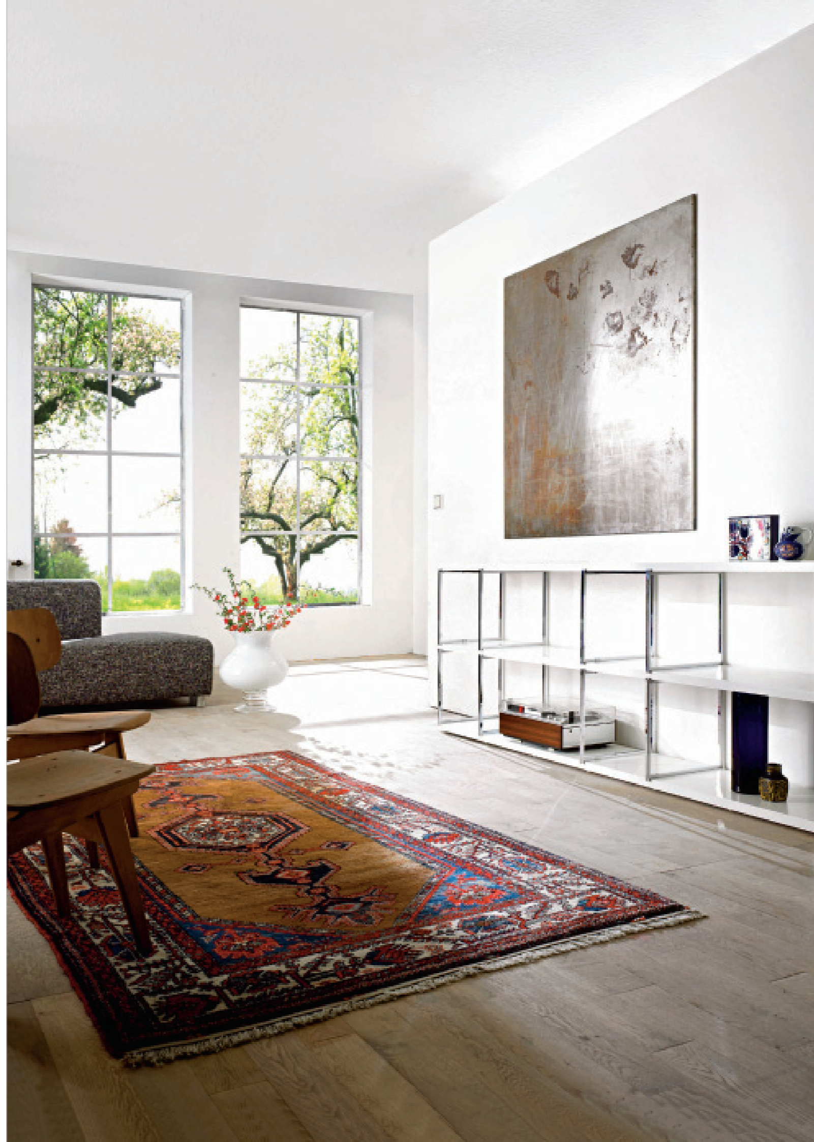
SUDBROCK Regalsystem Kubik / shelf system Kubik