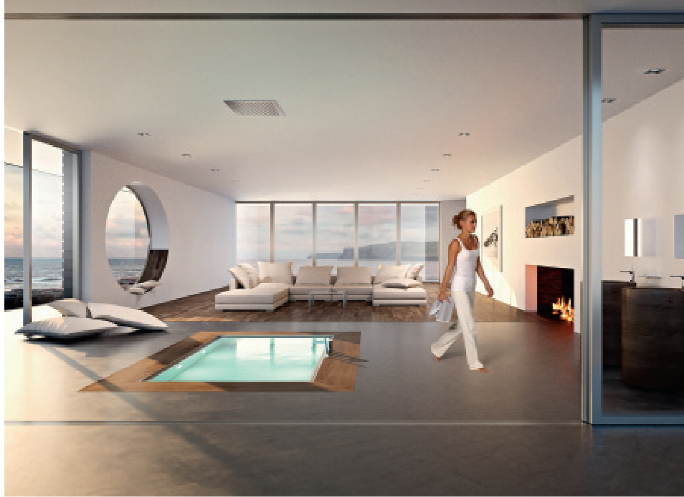
STUDIO TÖLLE Strandhaus / beach house