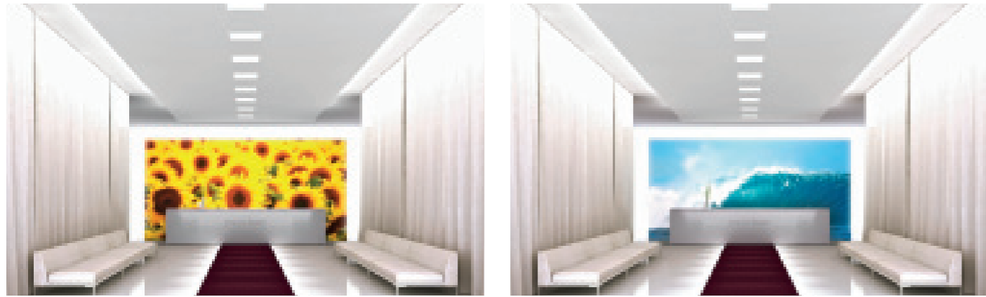
HOPF GRUPPE · Hotel RUE 199 Empfang / hotel lobby