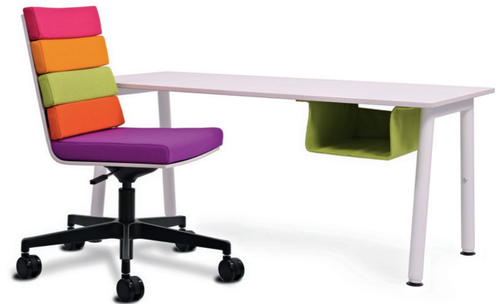
SITTING COOL. Markenbildung und Schulmöbel für Kinder / branding and school furniture for kids