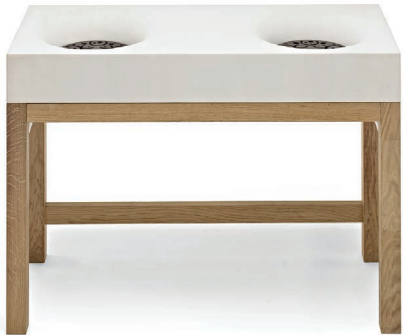
HANEL NATURSTEINMANUFAKTUR Marmor Waschtisch / solid marble wash basin