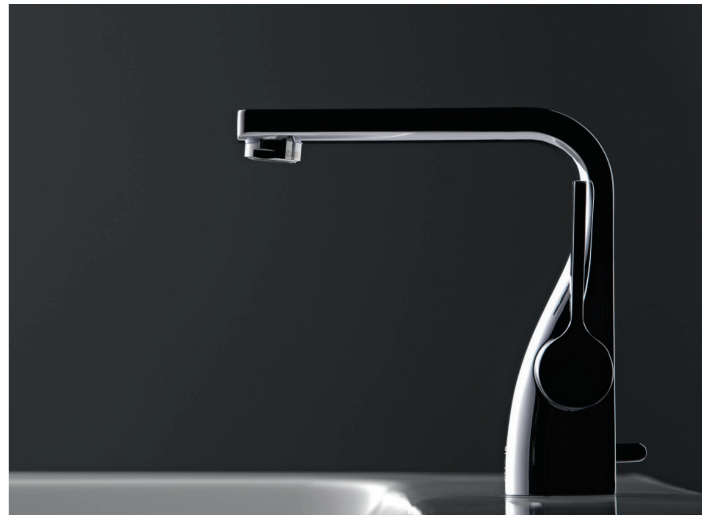
STEINBERG Waschtischmischer / basin mixer