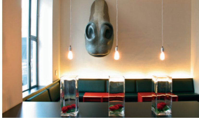
ARTE LUISE KUNSTHOTEL Empfang mit Wandskulptur von Hans van Meeuwen, Wandmalerei von Markus Linnenbrink / hotel lobby with integrated sculpture by Hans van Meeuwen, wall painting by Markus Linnenbrink