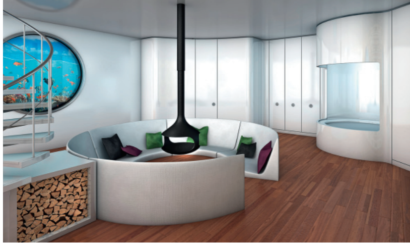
ABU DHABI URBAN VILLAGES LTD. Floating Hotel