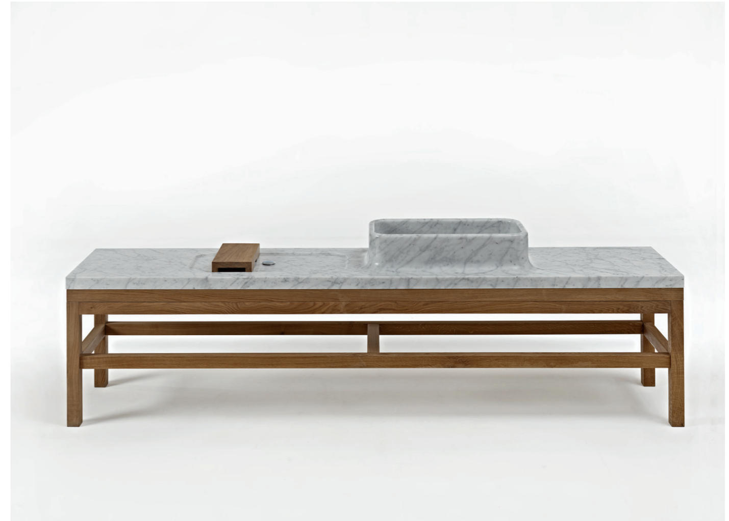
HANEL NATURSTEINMANUFAKTUR Küchenzuber / kitchen tub