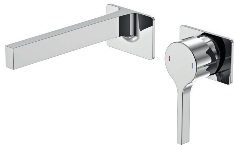
STEINBERG Waschtischmischer / basin mixer