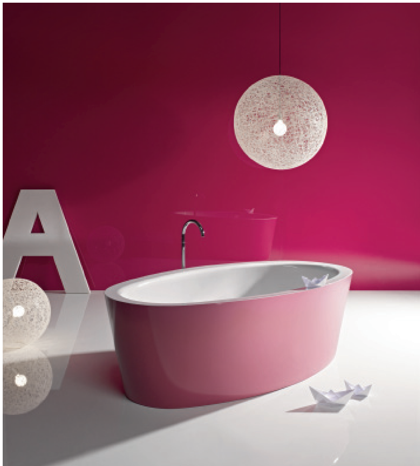
BETTE BetteHome Silhouette