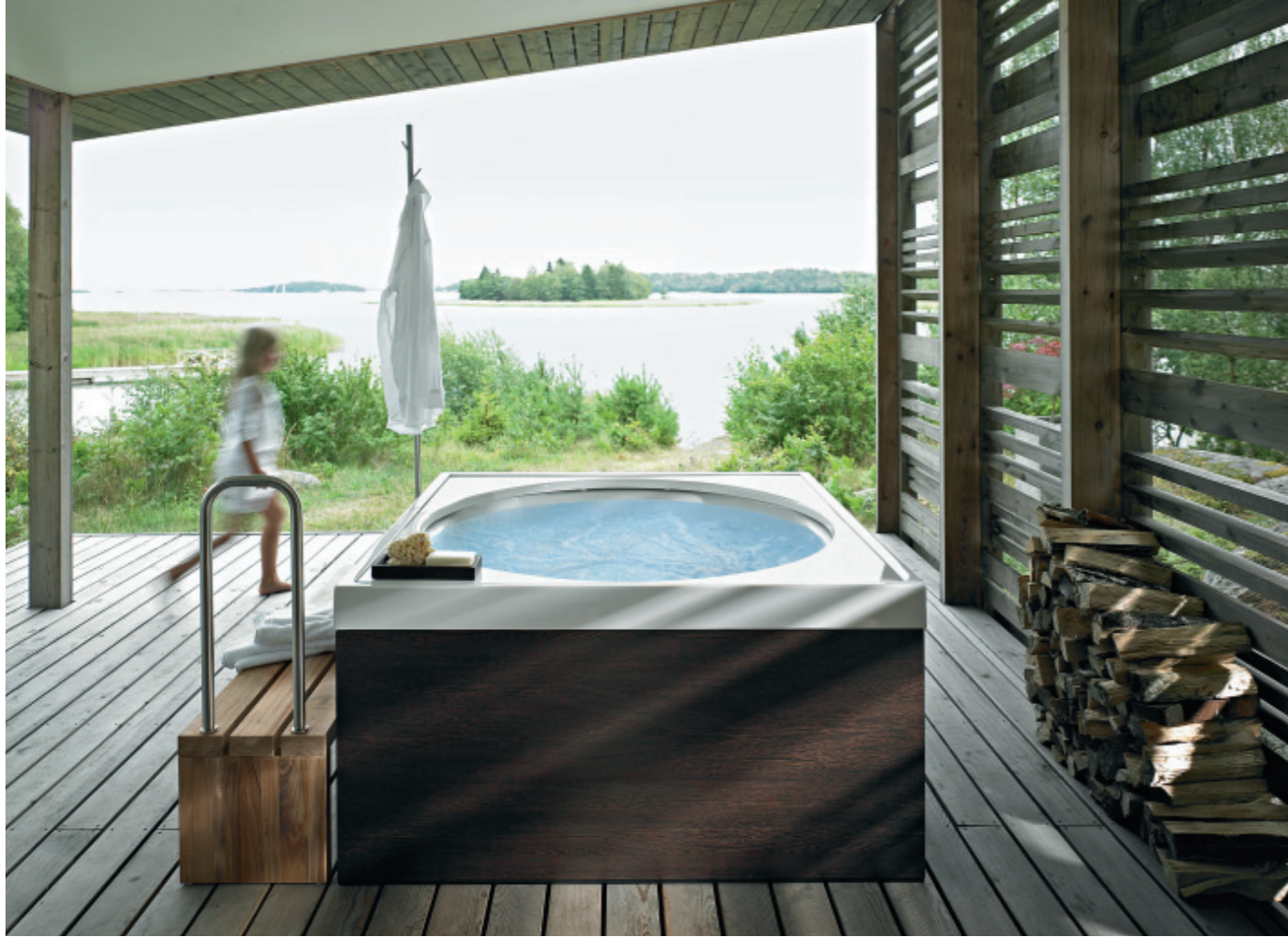
DURAVIT Blue Moon